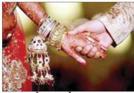
सात शुभ योग बन रहे

भड़ली नवमी पर एक साथ सात शुभ योग का निर्माण हो रहा है। माना जाता है कि इन योग में भगवान शिव की पूजा करने से सभी प्रकार के मनोरथ सिद्ध हो जाते हैं। इस योग का निर्माण सुबह सात बजे तक है। इसके बाद साध्य योग का संयोग बन रहा है। साध्य योग 16 जुलाई को सुबह सात बजे तक है। आषाढ़ माह के शुक्ल पक्ष की नवमी पर रवि योग का निर्माण हो रहा है। इस योग का निर्माण दिन भर है। ज्योतिष रवि योग को शुभ मानते हैं।